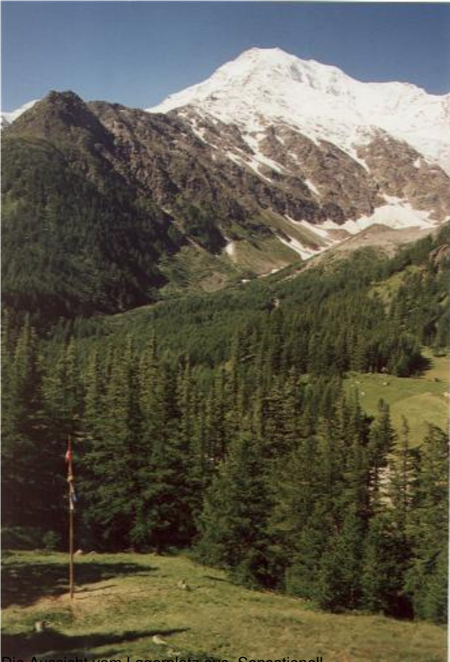
Die Aussicht vom Lagerplatz aus. Sensationell!

Geschrieben von: Garfield (StefanD) Mittwoch, den 06. Juli 2005 um 00:37 Uhr